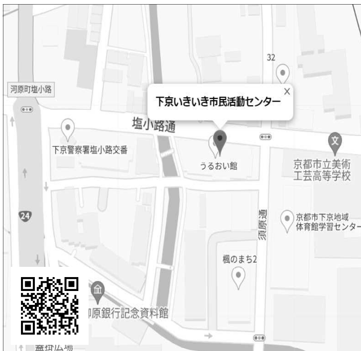
下京いきいき市民活動センター