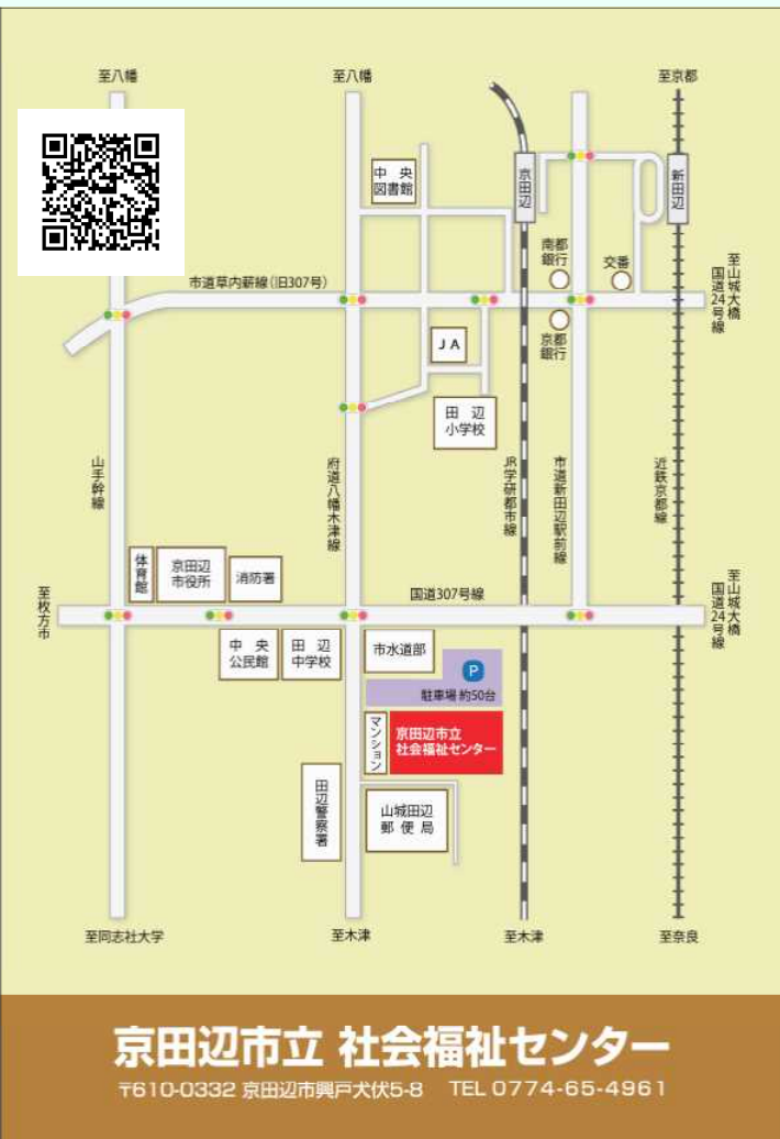
京田辺市立 社会福祉センター