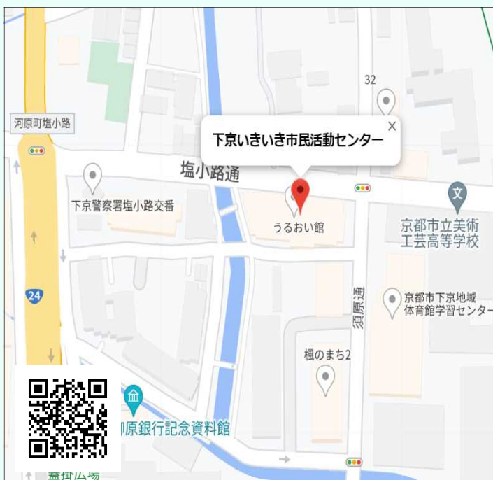
下京いきいき市民活動センター