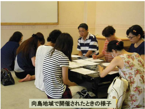
向島地域で開催されたときの様子