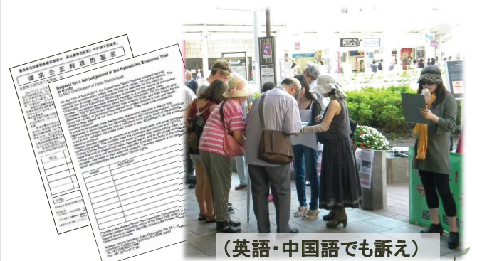
(英語・中国語でも訴え)