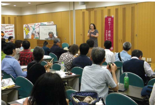
お昼の報告集会で発言する原告