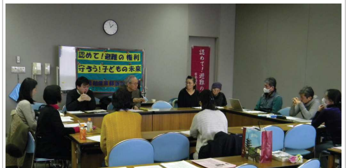
福島県郡山市にて開催